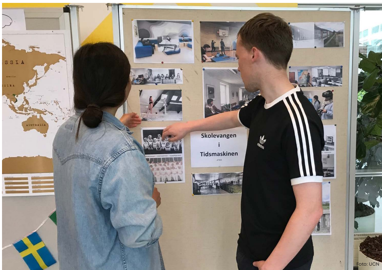
Studerende - Internationalt uge

Forløbet blev udbudt til undervisere på Campus Hjørring af biblioteket i samarbejde med undervisere på Natur- og Kulturformidleruddannelsen. Med udgangspunkt i UCN's Strategisk rammekontrakt (UCN, 2020) blev rammerne for diskussionen sat. Delmål tre i Strategisk rammekontrakt giver en pejling på, hvor de studerende er i forhold til anvendelsen af international litteratur, qua optælling af referencer i deres afsluttende opgaver, og giver i en periode på tre år (2018-2021) et øget fokus på, at de studerende får kompetencer til at søge og inddrage international litteratur, og understøtter herved et øget fokus på, at de studerende bliver informationskompetente.