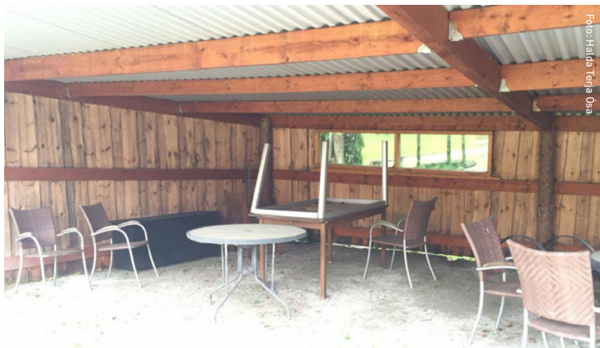
Figur 2: Udhuset ved bostedet.

Ved indvielsen af stedet inviteres beboere og pårørende på kaffe og kage, den røde snor klippes over af en aktiv beboer, og lederen af bostedet holder en lille tale. Hun påpeger det flotte arbejde og fortæller, at det har været spændende at følge processen, fra de studerende kom med et stykke blankt papir, til de holdt møder med beboerne om stedet og fandt ud af, hvordan det skulle være. Hun fortæller, at de har været der i al slags vejr og har skabt stedet sammen med beboerne. Alle de deltagende beboere har sat deres præg