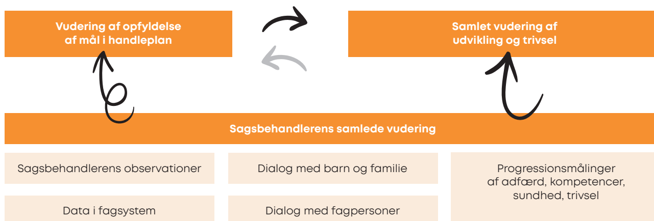
Figure 1. Elementer i sagsbehandlerens opfølgning på mål for barnet, dets udvikling og trivsel.

Som diskussionen ovenfor gerne skulle have vist, er der imidlertid tale om et falsk dilemma, for sagsbehandleren kan qua de forskellige dimensioner i barnets progression have behov for alle de nævnte typer af progressionsmålinger. Der er ikke behov for at vælge mellem fremgangsmåder, men for en systematik for, hvordan de kan kobles til hinanden i en sammenhængende model. Figur 1 viser et forslag til en sådan model for elementerne i opfølgning på barnets progression. Formålet er at indkredse en ramme for fremtidige studier af de processer og den vidensgenerering, der indgår.